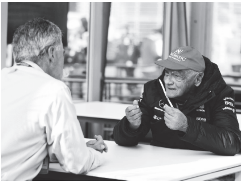
Chase Carey és Niki Lauda.

Úgy tudni azonban, hogy a két hét múlva esedékes bahreini hétvégén Chase Careyék előállnak reformterveikkel, s részletesen bemutatják azokat a csapatoknak. Egyelőre csak annyi tűnik biztosnak, hogy az átdolgozott motorszabályait ismertetik. Korábban a Nemzetközi Automobil-szövetséggel arról adtak hírt, hogy számos alkatrész egységesítésével tennék olcsóbbá, egyszerűbbé az erőforrásokat, amelyek ezen felül viszont a jelenlegi motorok alapjaira épülnének, azaz turbófeltöltős, V6-os hibrid egységek lennének.