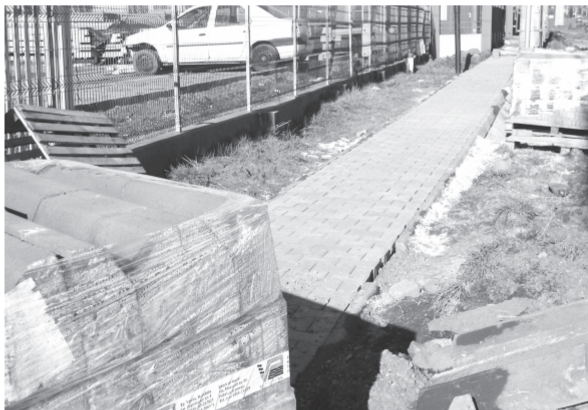
Már folyik a járdaépítés