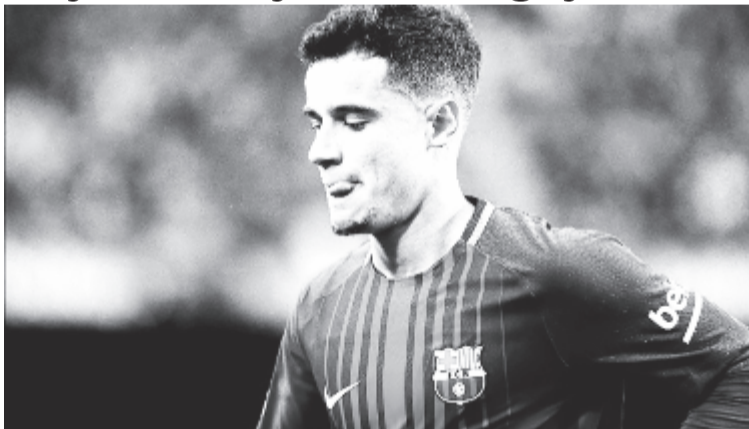
Coutinhónak várnia kell 2019-ig, ha BL-t akar nyerni a Barcával.

Döntés született az új kezdési időpontokról is: a Bajnokok Ligájában a selejtező rájátszásától a